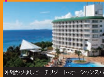
沖縄かりゆしビーチリゾート・オーシャンスパ