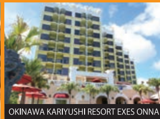
OKINAWA KARIYUSHI RESORT EXES ONNA