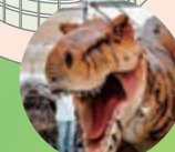
きょうりゅうがやってくる 18:00~20:30